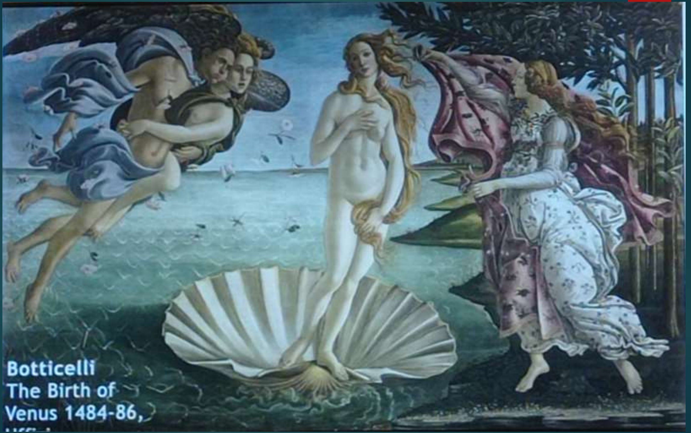
Botticelli The Birth of Venus 1484-86,