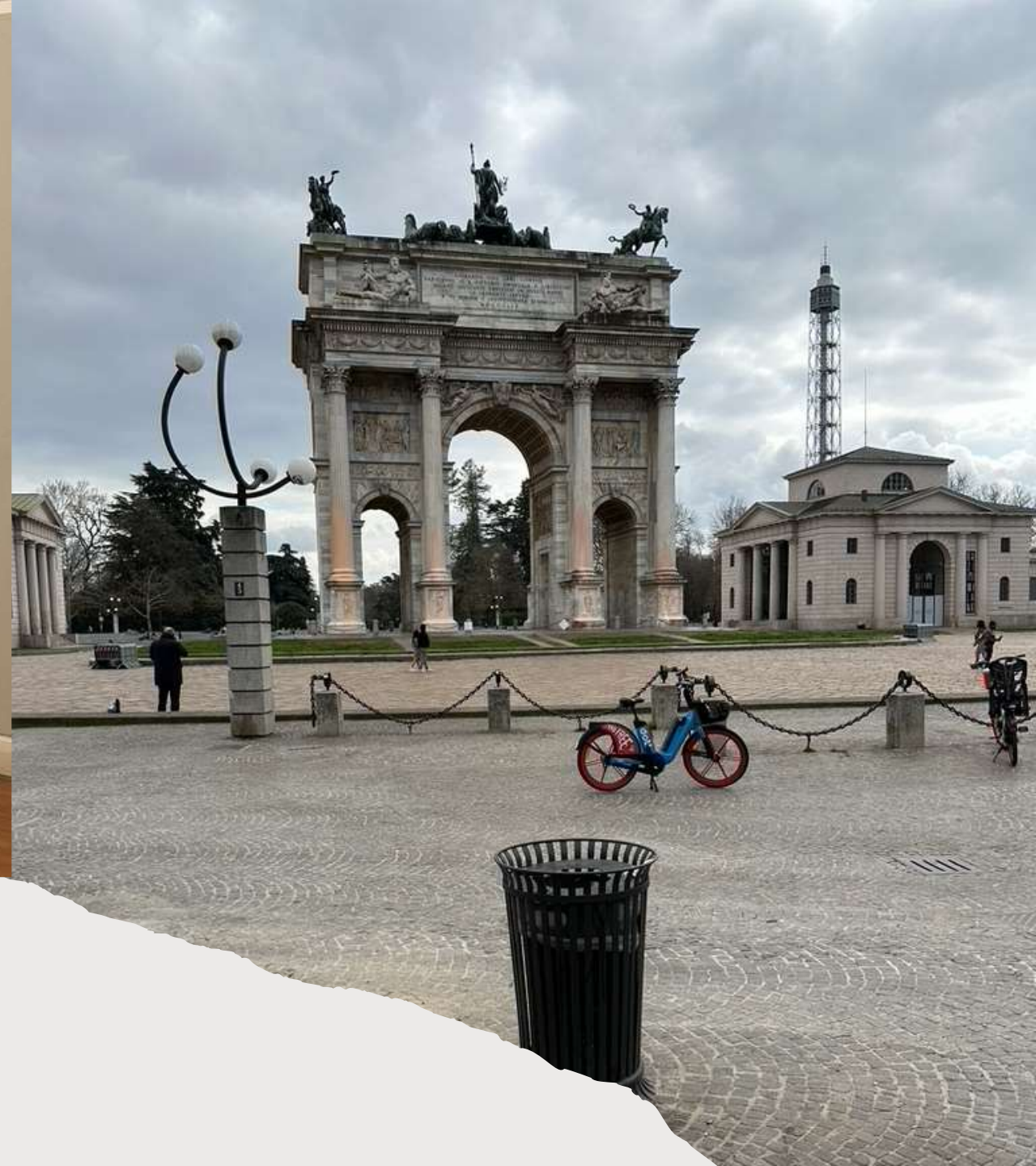
Europe for All-Olasz partner